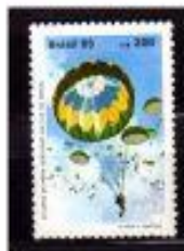
PARAQUEDISMO BRASIL 1985