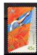
TÊNIS AUSTRÁLIA 2000