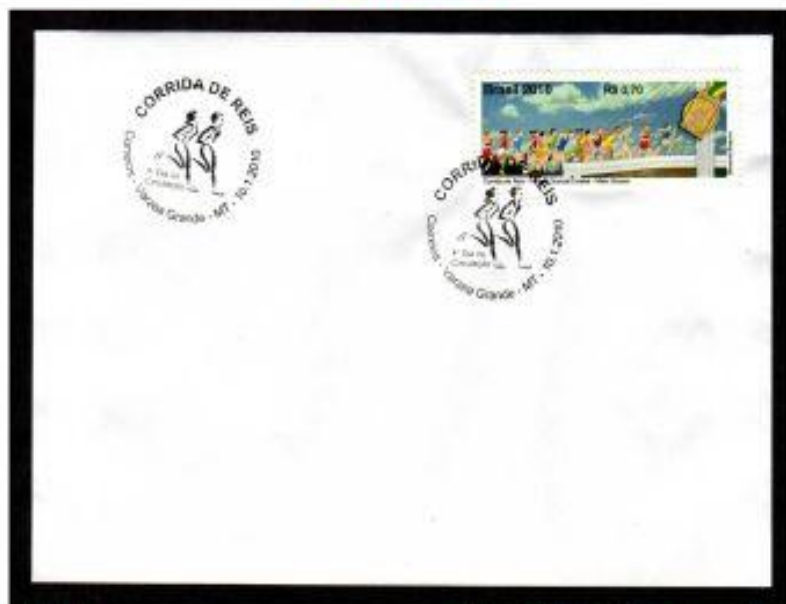
MARATONA BRASIL 2010