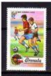
AFRANCADA PARA O GOL GRENADA 1974