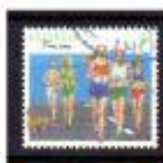
ESPORTE PARA TODOS AUSTRALIA 1990