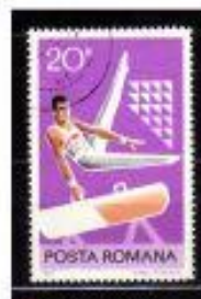
CANAL com ALÇAS ROMENIA 1977