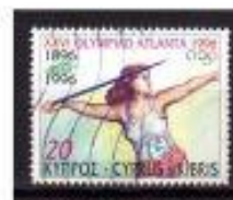
ARRMESSO de DÁRCO CYPRUS - GRÉCIA 1996