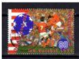
CELEBRANDO O GOL HOLANDA 1960