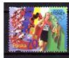
CORRIDA POLÓNIA 2000