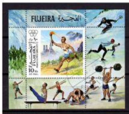
ESPORTES DIVERSOS FUJEIRA 1972