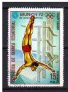
GUINE EQUATORIAL 1972