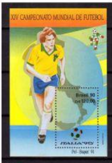
JOGADOR BRASIL 1960