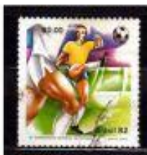
CHUTANDO A BOLA BRASIL 1962