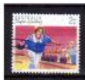
BOLICHE AUSTRÁLIA 1989