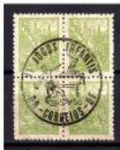
CAMPEÃO COMPARATIVO JOGOS INFANTIS BRASIL 1996