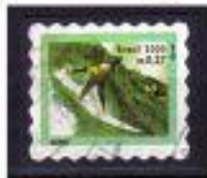
SURF BRASIL 2000