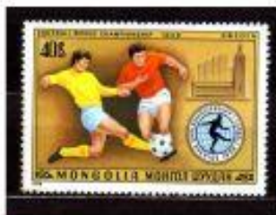
A DISPUTA MONGÓLIA 1978