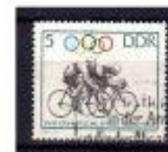
ALEMANHA ORIENTAL 1964