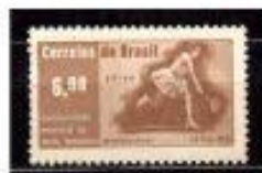
BRASIL CAMPEÃO MUNDIAL DE TÊNIS FEMININO MARGA KOSTER (URUGUAI) BRASIL 1990