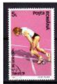
CORRIDA ROMENIA 1991