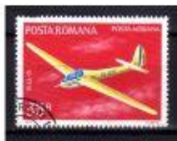
ESPORTE AEREO - PLANADOR ROMÊNIA 1977