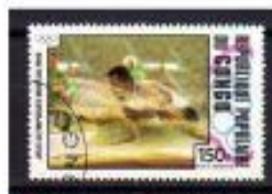
SALTO VERTICAL - ATERISSAGEM CONGO 1960