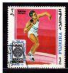
ARRMESSO de PESO FUJEIRA 1960