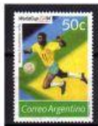
HOMENAGEANDO O BRASIL ARGENTINA 1964