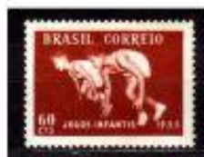
JUVENS ATLETAS BRASIL 1955