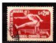
ESPORTE COM BARRERAS BRASIL 1955