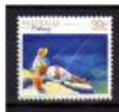
PESCARIA AUSTRÁLIA 1989