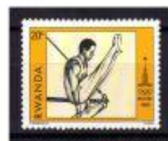
BARRAS ASSIMÉTRICAS RWANDA 1960