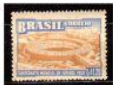
O ESTADIO DO MARACANÃ BRASIL 1950