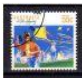
PIRA AUSTRÁLIA 1989