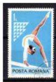
TRUQUE ROMENIA 1977