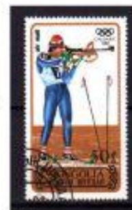
TIRO MONGÓLIA 1968