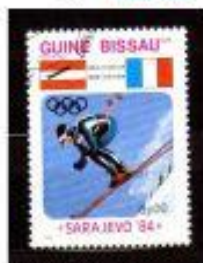
GUINE BISSAU 1984