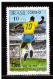
PELÉ, 1.000 GOLS BRASIL 1960