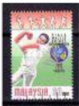
BASQUETE MALÁSIA 1987