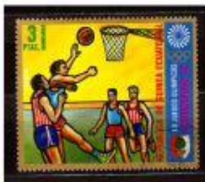
GUINE EQUATORIAL 1972