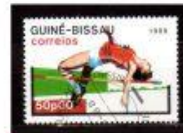
SALTO em ALTA GUINÉ BISSAU 1988