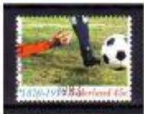
A BOLA, O PÉ, A DEFESA HOLANDA 1979