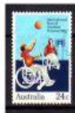
BASQUETEBOL AUSTRÁLIA 1984