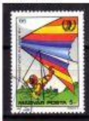
ASA DELTA HUNGRIA