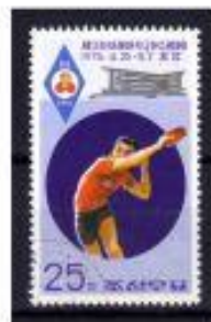
KOREA do SUL 1974