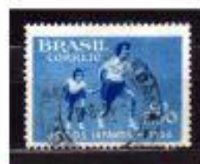
PROVA DE REVEZAMENTO BRASIL 1960