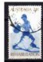
REABILITAÇÃO DE BOLA AUSTRÁLIA