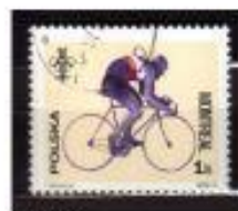
CICLISMO POLÓNIA 1976