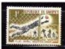
DEPENDENDO A PELOTA DAHOMÉY 1963