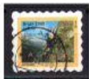
ALPESISMO BRASIL 2000