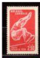
SALTO em DISTÂNCIA BRASIL, 1958