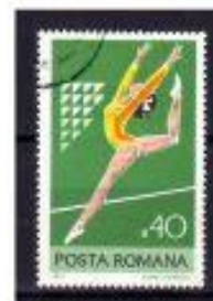
SOLO ROMENIA 1977