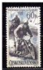
MOTOCICLISMO TCHECOSLOVÁQUIA 1967