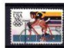
ESTADOS UNIDOS 1964