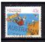
SHATE AUSTRÁLIA 1989