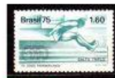
SALTO TRIPLO BRASIL, 1975