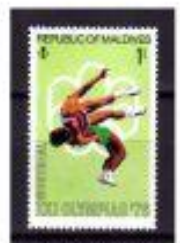
REPUBLICA MALDÍVAS 1976