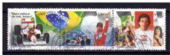
AUTOMOBILISMO BRASIL 1994