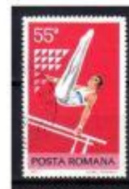
BARRAS PARALELAS ROMENIA