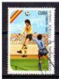
CABEÇANDO A BOLA CUBA 1962