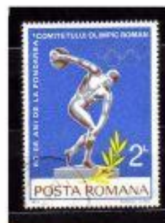
ARRMESSO de DISCO ROMENIA 1974