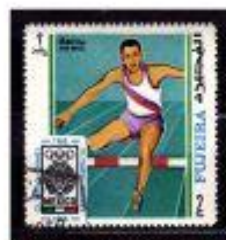
SÁBIO COM BARRERAS FUZEIRA 1966