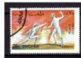
ESGRIMA DHUFAR - EMRADOS 1972