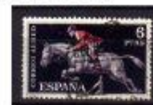
HÍPISMO ESPANHA 1960