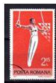
ARGOLAS ROMENIA 1977