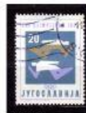
NATAÇÃO BULGÁRIA 1980