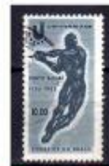
ARRMESSO de MARTELO BRASIL 1963