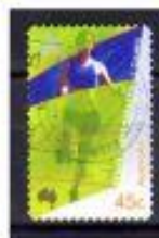
CRURIA AUSTRÁLIA 2000