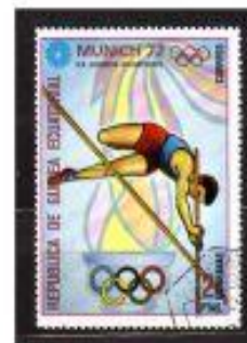
SALTO de ALTA GUINÉ EQUATORIAL 1972