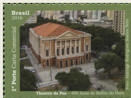
Selo de 2016 – Maravilhas de Belém do Pará –Theatro da Paz

No dia 15 de fevereiro de 1878 era aberto ao público o Theatro da Paz, em Belém, Pará. Construído com o dinheiro do rentável Ciclo da Borracha, hoje é o maior teatro da região norte e um dos mais luxuosos do Brasil. A primeira apresentação do teatro foi o espetáculo "As duas órfãs". Enquanto a região prosperava com o látex, várias companhias atuaram ali. Porém, como fim do período áureo do látex, o teatro também decaiu e, sem mais apresentações, permaneceu quase sempre fechado. Foi a primeira casa de espetáculos construída na Amazônia e tem características grandiosas: 1.100 lugares, acústica perfeita, lustres de cristal, piso em mosaico de madeiras nobres, afrescos nas paredes e teto, dezenas de obras de arte, gradis e outros elementos decorativos revestidos com folhas de ouro. Hoje, revitalizado, é considerado um dos Teatros-Monumentos do País.