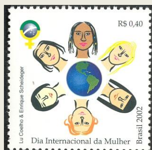
Selo de 2002 – Comemorativo do Dia Internacional da Mulher

O Dia Internacional da Mulher é comemorado anualmente em 8 de março, e é a celebração das conquistas sociais, políticas e econômicas das mulheres ao longo dos anos, sendo adotado pela Organização das Nações Unidas e, conseqüentemente, por diversos países. A ideia de um Dia Internacional da Mulher surgiu no final do século XIX, que foi, no mundo industrializado, um período de expansão e turbulência, crescimento fulgurante da população e ideologias radicais. As jornadas de trabalho de 15 horas diárias e a discriminação de gênero eram alguns dos pontos que eram debatidos pelas manifestantes da época. Já nas primeiras décadas do século XX, as mulheres começam a lutar pelo direito ao voto e à participação política. Atualmente, além do caráter festivo e comemorativo, o Dia Internacional da Mulher ainda continua servindo como conscientização para evitar as desigualdades de gênero em todas as sociedades.